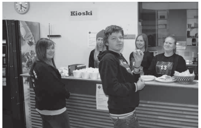
Hamiksen Cinema-kioskilla hammaslahtelaisia nuoria