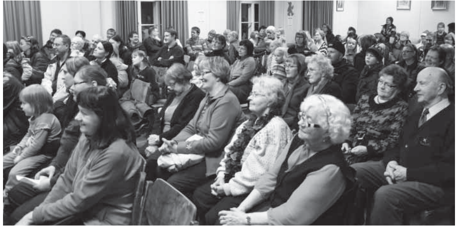
Hammaslahden Joulunavaus 29.11.2012 NS-talolla